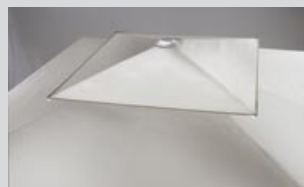
Ansprechende Optik – das charakteristische Winddach.