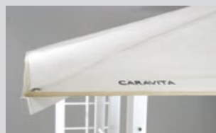
Beste Tuchqualitäten garantieren perfekten Sitz der Dachbespannung.